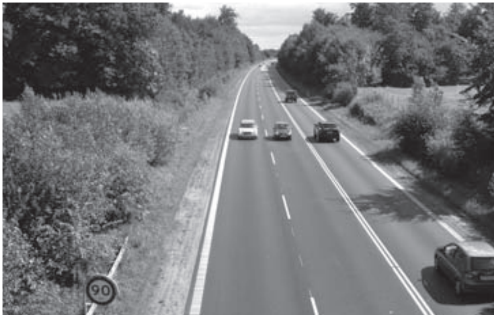
Motortrafikvejen, hvor den kører under Brødeskovvej, anno 2007.

Hillerød – Hundested stopper på Brødeskov station nær Nr. Herlev. Dette tog, der også kører om aftenen, er blevet forbedret flere gange m.h.t. både hyppighed og vognkvalitet. I øvrigt var der fra stationens åbning i 1950 indtil 1981 posthus og personlig baneekspedition 3 .