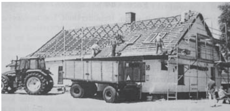
Hammersholt Forsamlingshus i 2004, hvor der blev lagt nyt tag.