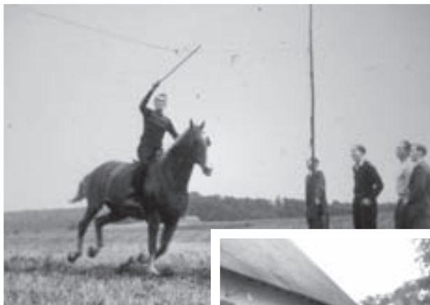
Ridning ved sommerfest i Nr. Herlev i 1950'erne.

Fra ca. 1960 skete en række forandringer af vidt forskellig karakter, hvilket i løbet af få år medførte en ændret kultur med nye livsformer. Man kan sige, at ændringerne startede i sognerådet, som tillod de første udstykninger. Men man kan nok bedre sige, at det var især de mange nye beboere, som skabte den nye kultur, der også var forskellig fra den kultur, de kom fra. Dette spillede sammen med den optimistiske indstilling i både økonomiske og andre forhold, der opstod lidt ind i 60'erne i hele Danmark. Man turde nu gældsætte sig og investere. Et befolkningspres fra de store byer - ikke mindst fra København og Nordsjælland - resulterede i, at mange unge og yngre familier slog sig ned i f. eks. Brødskovområdet. Grundene var billigere end grundene nærmere København eller nærmere Øresund. Grundprisen betød nok noget for den sociale baggrund hos de folk, der flyttede til