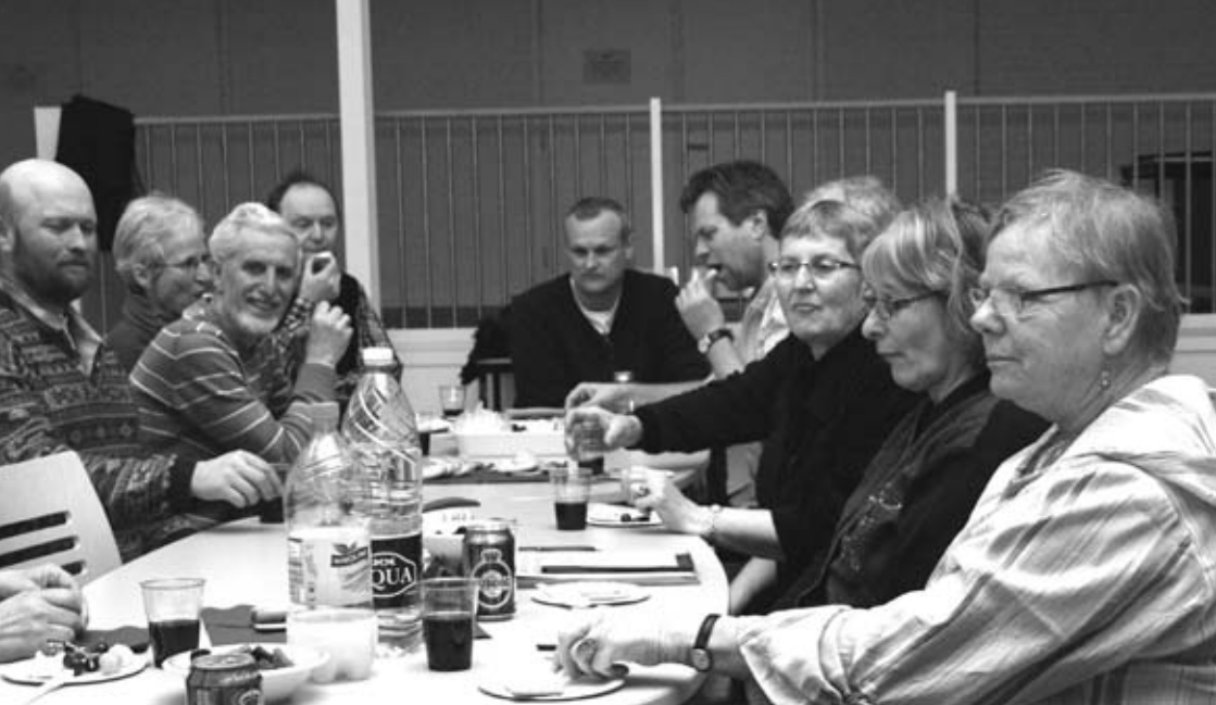
Deltagere ved Lokalrådets Generalforsamling