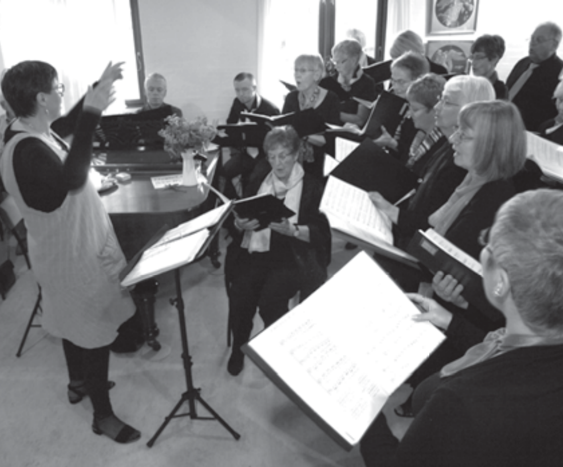
Forårskoncerten 2013.

Forårssæsonen byder på endnu flere oplevelser, da vores venskabskor i Finland "Lovisakören" har inviteret Brødeskovkoret til Lovisa i forbindelse med Musikforbundets 100 års jubilæum.