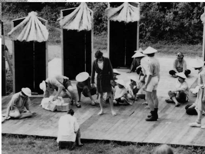
I 1981 blev "Det lille tehus" opført på gulvet på "Petras eng".

stadig og kan til nød stadig bruges om end de er noget medtagne. Tømmeret som de hviler på, er forsvundet. (Gulvet blev faktisk brugt en gang i 2015).