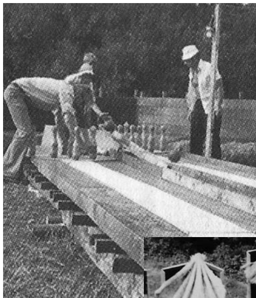
Borgerforeningens dansegulv. Her spilles kegler på det i 1975.