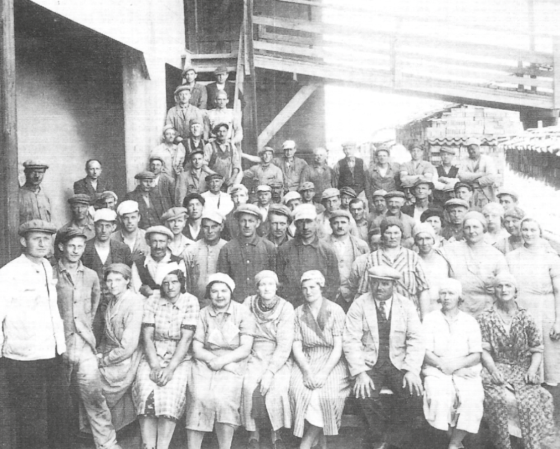
Arbejdere på Hammersholt teglværk. En stor del af var indvandrere fra Sverige og Polen. Mange boede i Ll. Sverige, Hammersholt og Nr. Herlev.

større madpakke med, end vi plejede. Selvfølgelig havde vi også vores særlige snapseregler med "Skurglas" - det vil sige, et glas hvor foden var knækket af, men stilken var intakt. Ved hjælp af en gartrisse fik man en udmærket fod på glasset.