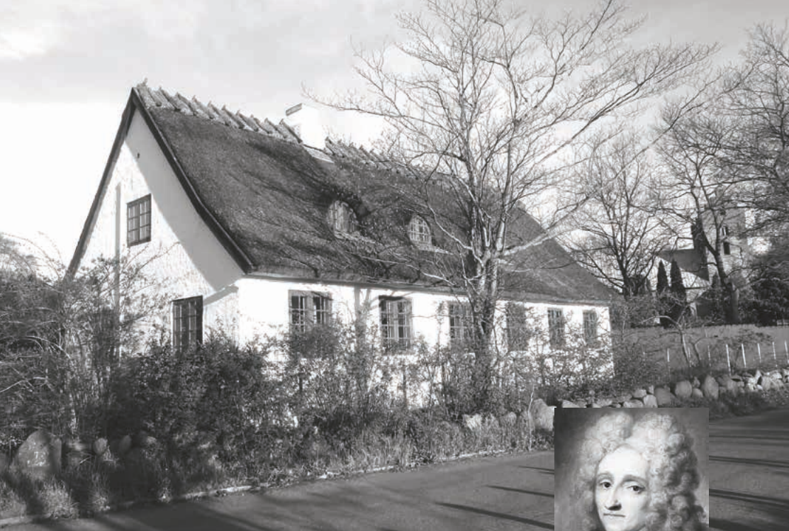
Rytterskolen i Nr. Herlev, som blev oprettet under Frederik den IV, med kirken i baggrunden

give sin tilladelse til dette, pålagde Frederik den IV ham desuden at udarbejde en plan for rytterskolerne i resten af landet. Samlet set blev der bygget 20 skoler i hvert rytterdistrikt – det vil sige 240 skoler over hele landet.