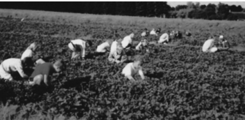
Jordbærplukning på Rydegård, Ved Freerslev Hegn 8.

Sådanne forhold var i 1800-årene og tidligere ganske typiske for børn, især for børn af fattige forældre. Børn kunne også blive sendt på arbejde hos nabo mod betaling til forældrene. Nogle af disse børn fortalte som voksne, at de ofte glædede sig til at komme i skole, som var mindre krævende og sjovere.