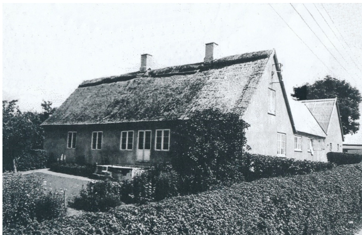
Hammerholt Gl. Skole ca. 1906. (Fotograf ukendt. (BLF)) Hammersholt nye skole 1949. (Fotograf ukendt. (BLF)).