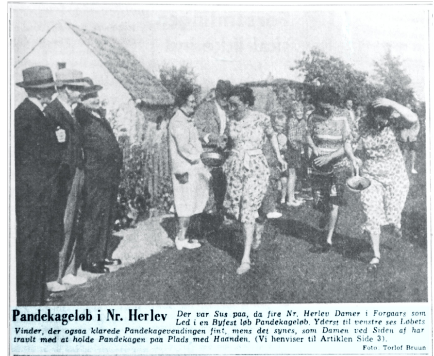
Pandekageløb i Nr. Herlev Der var Sus paa, da fire Nr. Herlev Damer i Forgaars som Led i en Byfest løb Pandekageløb. Yderst til venstre ses Løbets Vinder, der ogsaa klarede Pandekagevendingen fint, mens det synes, som Damen ved Siden af har travlt med at holde Pandekagen paa Plads med Haanden. (Vi henviser til Artiklen Side 3).

Men tro derfor ikke, at Nr. Herlev sover Tornerosesøvn. Netop den Velholdthed, Byen præges af, er jo et Tegn paa, at der er Liv, at der hentes Velstand til Huse, at der er Initiativ. Hvis man ikke vidste det før, kunde man faa Bevis for det i Forgaars. Nr. Herlev havde Byfest. Fest med ideelt Formaal. Et af Formaalene med Byfesten var at skaffe Midler til Forsamlingshuset, det Forsamlingshus, som danner Rammen om nuværende og kommende Slægters Virke. Det er her, man har lyttet til gode Foredrag; det er her, man har dyrket Fortidens Dans i Folkedanseform, det er her Ungdommen (og Old Boys med for den