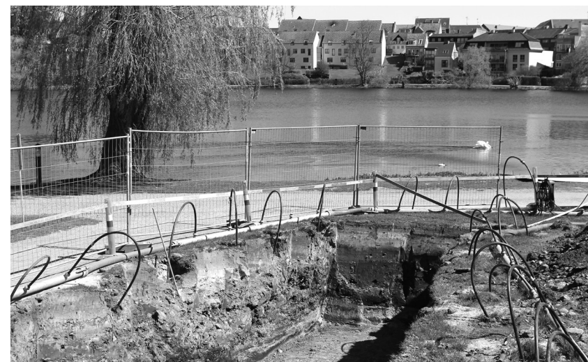
Udgravninger på Posen 2022.

Du kan også høre om Spiritusaffæren i Freerslev" og "Børnemis-handlingssagen i Nr. Herlev" samt om stort og småt, glæde og sorg i Brødeskovsområdet i det herrens år 1923 J Vi glæder os !